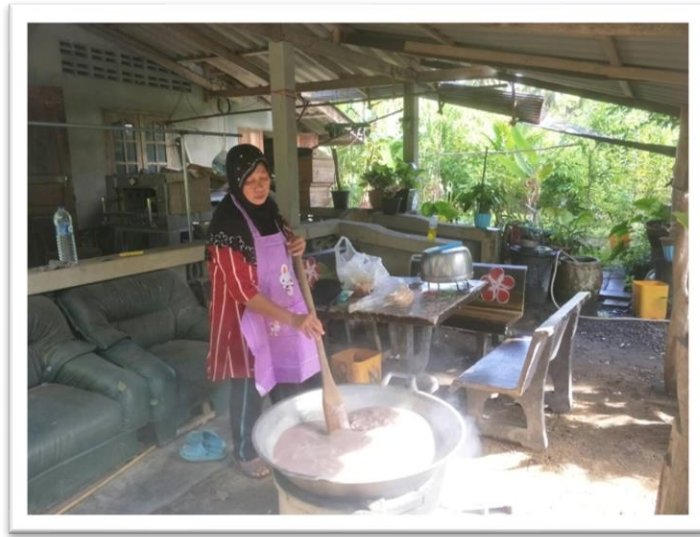
ขนมไข่ปลา

โดยมีกลุ่มชาวบ้านในพื้นที่หมู่ที่ ๘ บ้านเขาพนม ตำบลปาร่อน อำเภอกาญจนดิษฐ์ จังหวัดสุราษฎร์ธานี รวมกลุ่มจัดทำขึ้นเพื่อจำหน่าย เป็นการสร้างรายได้เข้าสู่ชุมชน